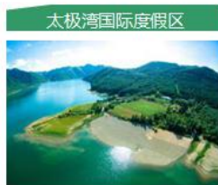
太极湾国际度假区