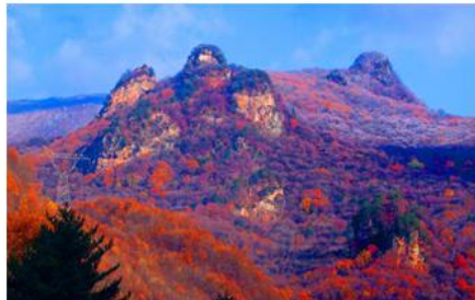
五女峰国家森林公园景区