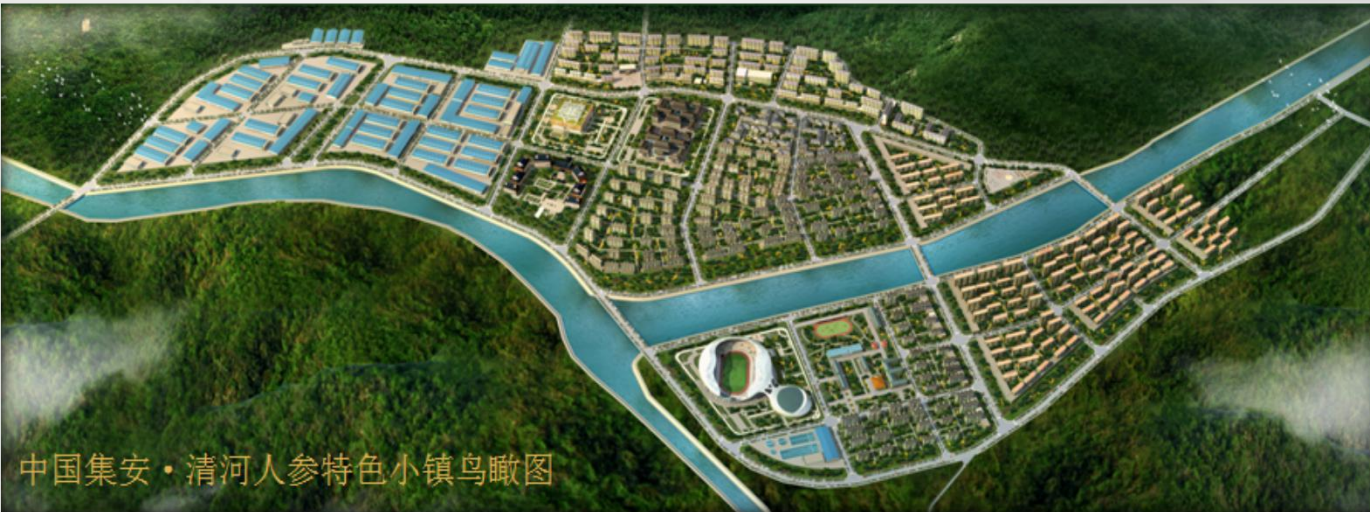
中国集安·清河人参特色小镇鸟瞰图

2017年清河镇被确定为全国唯一一个以人参产业为核心的特色小镇。小镇占地面积4.5平方公里，总投资50亿元，主要发展以人参为核心的健康产业及配套基础设施等