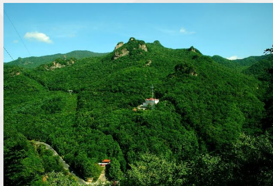
国家生态文明建设示范市

集安素有“北方江南”之美誉，是全国第三批“绿水青山就是金山银山”实践创新基地，森林覆盖率达82.16%，空气质量优良天数超过330天，城区PM2.5指数保持在2—20之间，气候条件在全省有“四最”，即平均降雨量最多、年积温最高、无霜期最长、风速最低，年平均气温7℃，人均寿命80.7岁。已成功引进江苏澳洋集团建设集安·澳洋颐养源益康养综合体项目，计划总投资10.3亿元，项目将开创我市“预防、养生、医疗、养老”深度融合的健康养老服务新体系