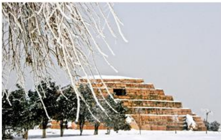
高句丽文物古迹景区